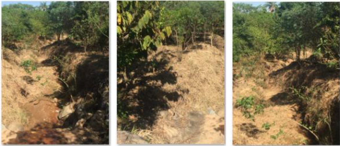
Fotos 11, 12 e 13: Retirada das espécies invasoras ao longo do córrego