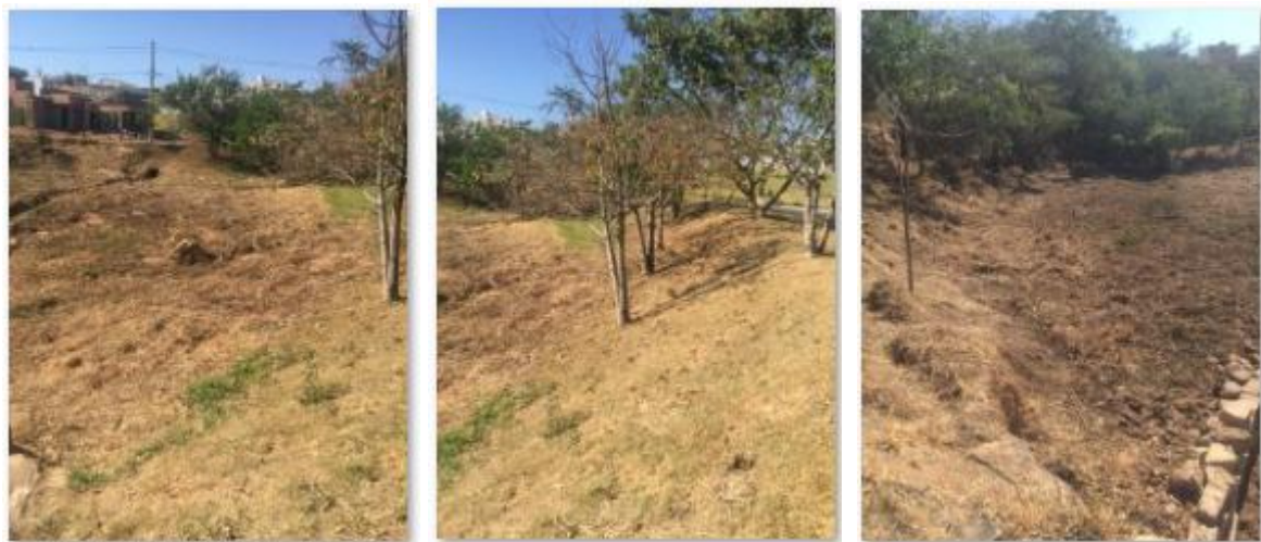
Fotos 14, 15 e 16: Limpeza geral da área, com roçada e retirada de troncos e galhos mortos. Plantio de novas mudas nativas ao longo de toda área