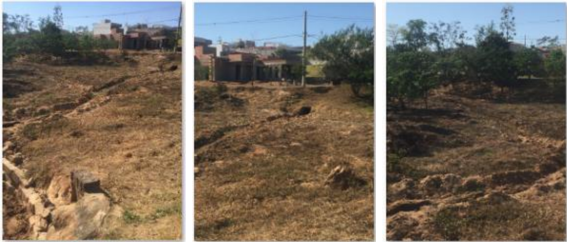
Fotos 08, 09 e 10: Abertura de sulco na lateral do córrego, para escoamento de água pluvial