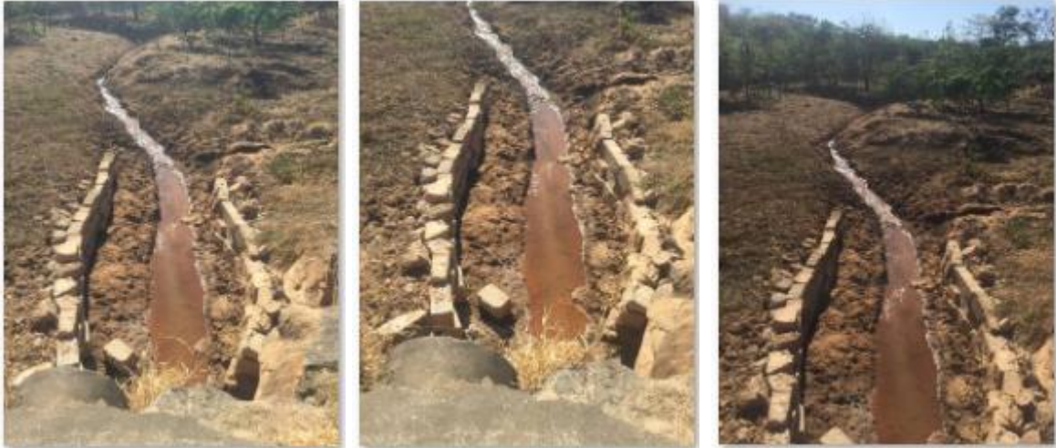
Fotos 05, 06 e 07: Retirada da barragem, limpeza e alargamento do córrego