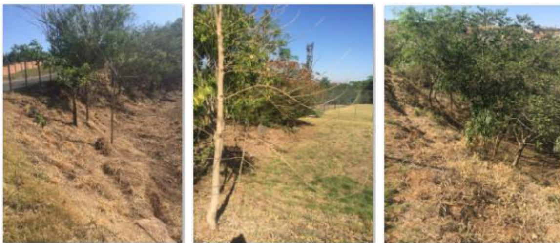
Fotos 17, 18 e 19: Limpeza geral da área, com roçada e retirada de troncos e galhos mortos. Plantio de novas mudas nativas ao longo de toda área